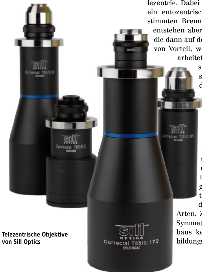
Telezentrische Objektive von Sill Optics