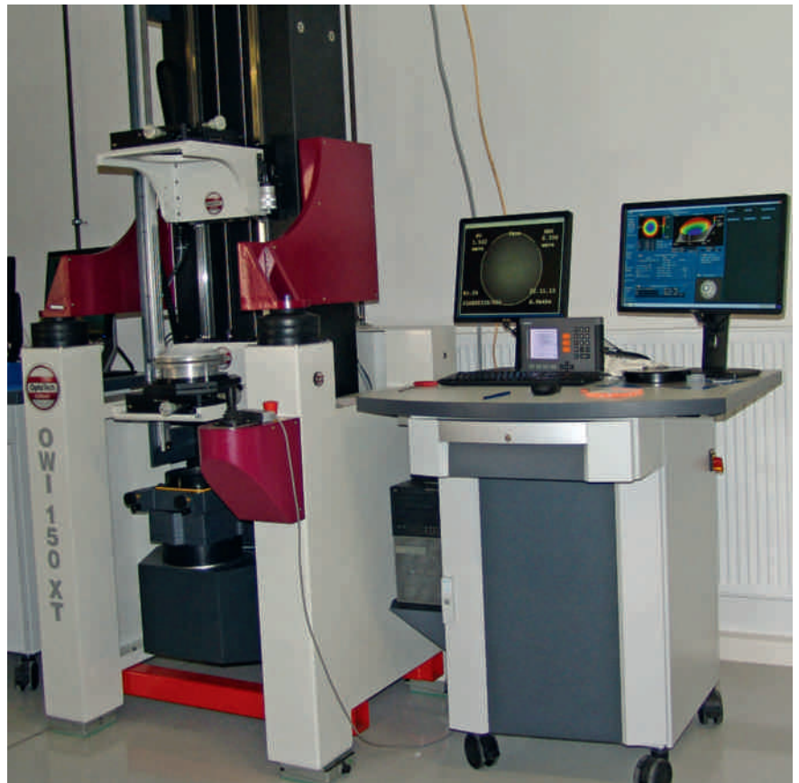
Inline-Prüf- und Messtechnik sowie \mu -genaue Toleranzen kennzeichnen die Herstellung optischer Linsen bei Sill Optics.

Zingrebe: Hierbei sind zwei Dinge zu beachten. Wenn der Kunde relevante Änderungswünsche hat und wir diese berücksichtigen, werden die damit verbundenen Mehrkosten mit dem Kun-