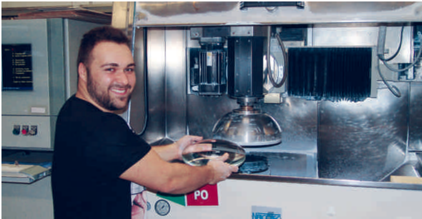
Große Optiken bis 300 mm Durchmesser werden bei Sill Optics ebenfalls mittels CNC-gesteuerten mehrachsigen Schleifmaschinen aus einem Glasrohling hergestellt.

be der Hightech-Strategie 2020 seitens der Bundesregierung über die Photonik aus?